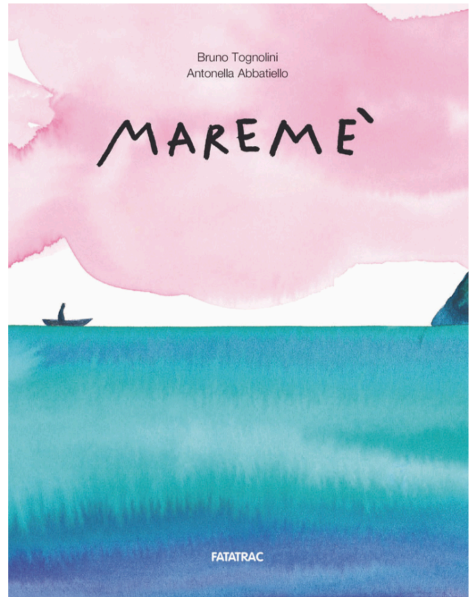
Maremé di Antonella Abbatiello e Bruno Tognolini Fatatrac, Casalecchio di Reno, Bologna (2008)

Ciò che è più grande di noi può essere anche dentro di noi? Riusciamo a sentirci parte di qualcosa pur nella nostra unicità? Davvero assomigliamo al mare?