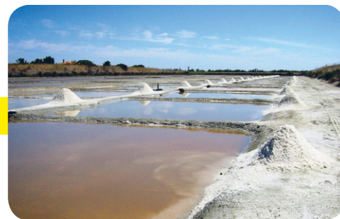
Fig. 3 Salina, VI sec. a.C. Il sale fu una delle prime attività produttive dei Romani