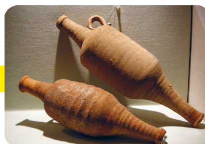
Fig. 5 L'anfora (I sec. a.C.) è un grande vaso di terracotta usato per la conservazione e il trasporto di liquidi: vino, olio e garum