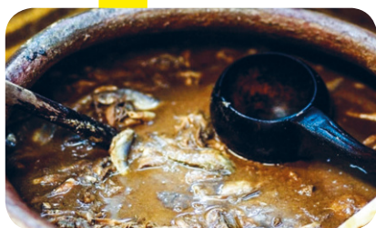
Fig. 4 Il garum , la salsa preferita dai Romani, un impasto di pesce che veniva usato principalmente per insaporire o accompagnare un gran numero di pasti