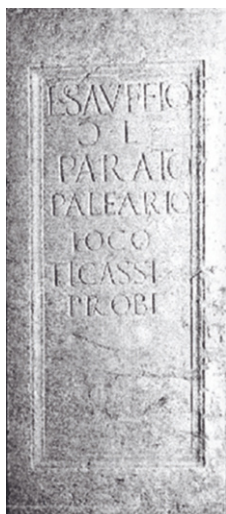
Fig. 6 Lapide di una tomba con iscrizione. Didascalia: L. SAUFEIO PARATO PALEARIO (a Lucio Saufeio Parato venditore di paglia). Museo di Este (PD) I sec. d. C.