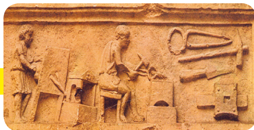
Fig. 2 Stele del fabbro, seconda metà I secolo d.C. (Aquileia, Museo Archeologico Nazionale). Gli artigiani erano molto orgogliosi del proprio mestiere: spesso sulle loro tombe facevano raffigurare scene del loro lavoro