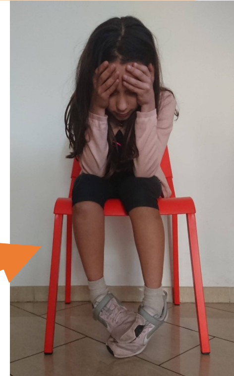
Metodo Teatro in Gioco®