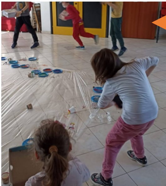
Metodo Teatro in Gioco®

«Stiamo lavorando sulla gioia: bambine e bambini stanno creando una “scatola della gioia” mentre ascoltano la musica: il corpo è protagonista dell’atto espressivo».