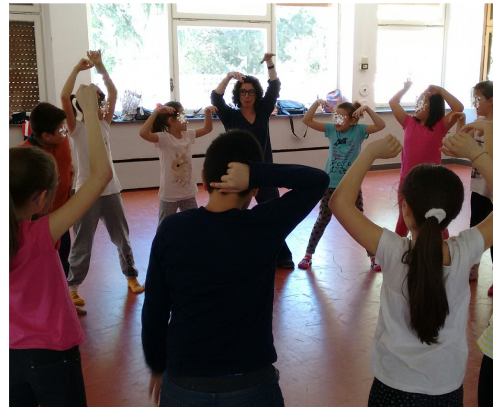
Metodo Teatro in Gioco®