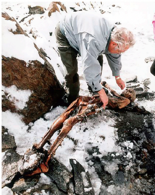
La mummia di Ötzi sul luogo del ritrovamento

Immedesimiamoci in Ötzi ed esercitiamo la metacognizione, divertendoci a rispondere a queste domande: “Che cosa posso abbattere con una robusta ascia di rame? Qual è lo strumento utile a tagliare pezzetti di cibo? Con che cosa taglio/cucio pelli e pellicce?” e così via.