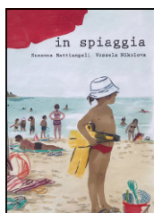
Mattiangeli, S., Nikolova, V. (2018). In spiaggia . Milano: Topipittori.

Organizziamo i bambini in gruppi di tre o quattro (in base al luogo in cui hanno trascorso le vacanze e alle loro competenze linguistiche). Chiediamo di abbozzare quattro immagini di due cose belle da fare nel luogo in cui hanno trascorso le vacanze e di due cose meno belle e di scrivere per ciascuna una breve didascalia. La scelta deve essere legata a un'esperienza vissuta direttamente da almeno uno dei membri del gruppo. Revisioniamo insieme ai bambini testo e immagini. Poi proponiamo l'attività del LABORATORIO .