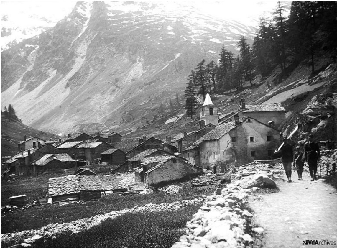
Villaggio di Fornet (Valgrisenche) prima della costruzione della diga