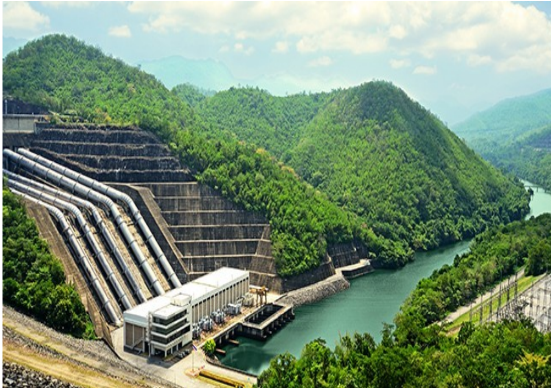
Le condotte forzate e centrale