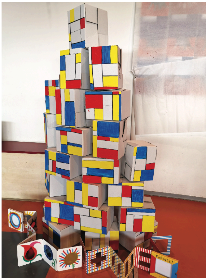
Riqualifichiamo vecchie scatole con i colori primari per entrare nell'arte di Mondrian.

Osserviamo le piccole cose che abbiamo in sezione e lasciamoci ispirare... per recuperare e dare nuova vita a vecchi materiali. Diventerà così facile e divertente promuovere abilità creative nei bambini, e dunque favorire lo sviluppo di pensieri divergenti e innovativi.