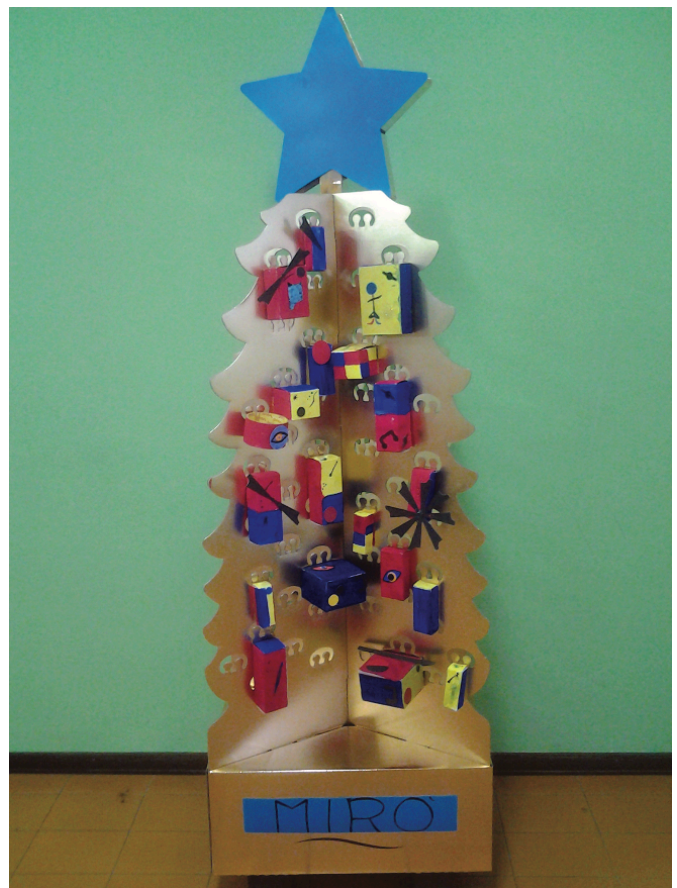
Scomponiamo e ricomponiamo i quadri di Miró per interiorizzare linee e segni grafici.