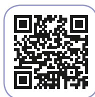
ASCOLTA LA CANZONE "Welcome"

Ogni nome rappresenta un bambino con la propria personalità e tutti insieme formano una classe, come un campo di fiori. Proponiamo l' ATELIER e sottolineiamo l'unicità di ciascuno.