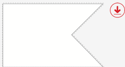
Fig. 1 Modello di bandierina