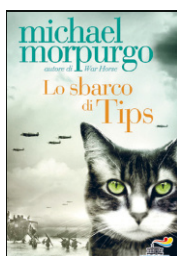
Morpurgo, M. (2018). Lo sbarco di Tips . Milano: Il battello a vapore.

Lo sbarco di Tips . Milano: Il battello a vapore.