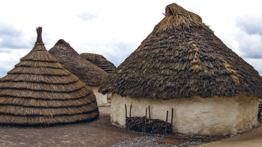
Fig. 1 Ricostruzione di un villaggio neolitico