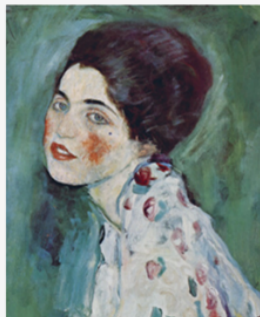
Gustav Klimt, Ritratto di signora (1915-17)