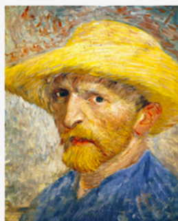
Vincent Van Gogh, Autoritratto (1887)