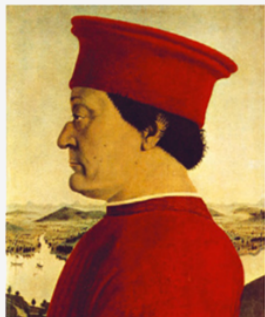
Piero Della Francesca, Federigo da Montefeltro (1465)

3. Ogni gruppo legge la propria descrizione alla classe e i compagni devono indovinare a quale quadro si sta facendo riferimento.