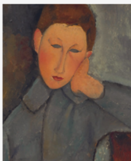
Amedeo Modigliani, Il ragazzo (1918)