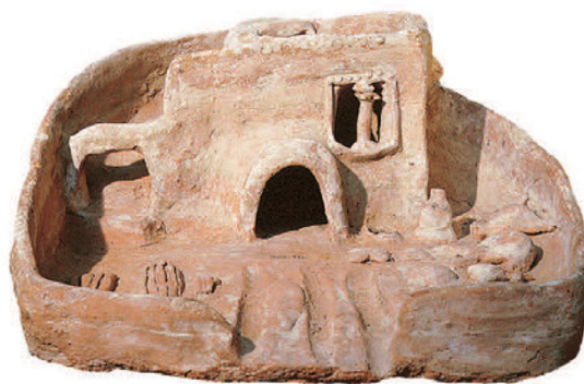
Modellino di casa egizia

Infine, proponiamo il LABORATORIO a tutta la classe.