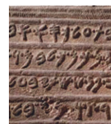
5. scrittura fonetica