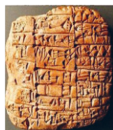
2. scrittura cuneiforme