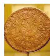
6. scrittura lineare