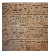
3. scrittura geroglifica