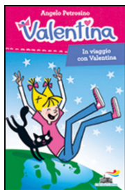
Petrosino, A. (2002). In viaggio con Valentina . Milano: Piemme

Prendiamo spunto dalle località visitate durante il periodo estivo. Leggiamo un brano della letteratura di viaggio per l'infanzia (A. Petrosino, In viaggio con Valentina ) e ritroviamo su un planisfero i luoghi visitati dal protagonista. Immaginiamo poi che venga a visitare il nostro territorio e che ci chieda di informarlo su che cosa possa trovarvi. Indaghiamo il territorio osservandolo dall'alto con l'aiuto dei filmati disponibili su Dronestagram. Riconosciamo le aree in cui è articolato, denominiamole e cerchiamo di capire insieme quale utilità abbiano per i membri della comunità. Realizziamo un breve video per l'ipotetico personaggio-visitatore del nostro territorio, valorizzandone le attrattive.