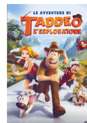
Le avventure di Taddeo l'esploratore (2012)

Esercitiemo la percezione dello spazio con l'esplorazione di un giardino