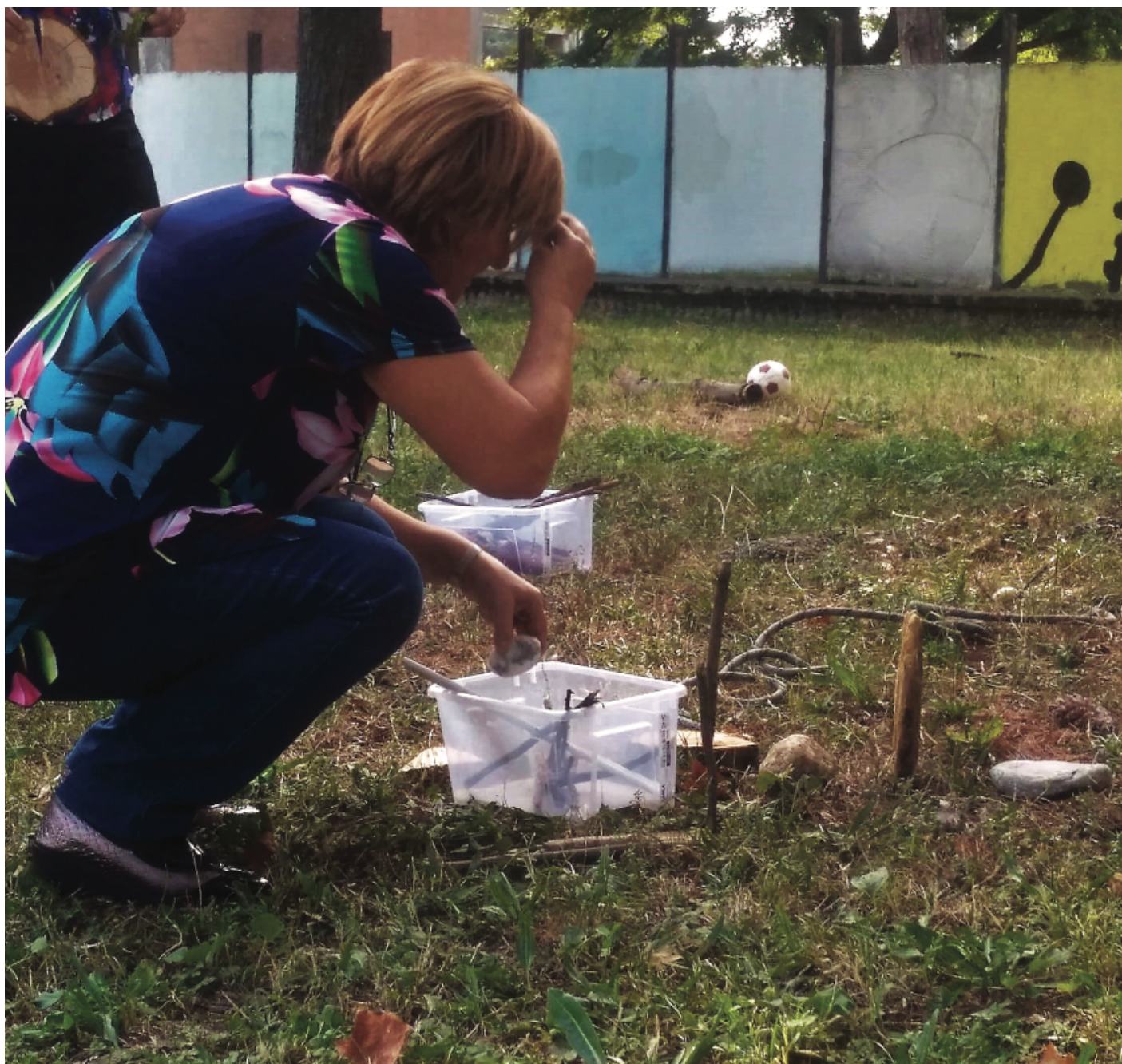
L'albero felice: decorazioni naturali all'aperto.