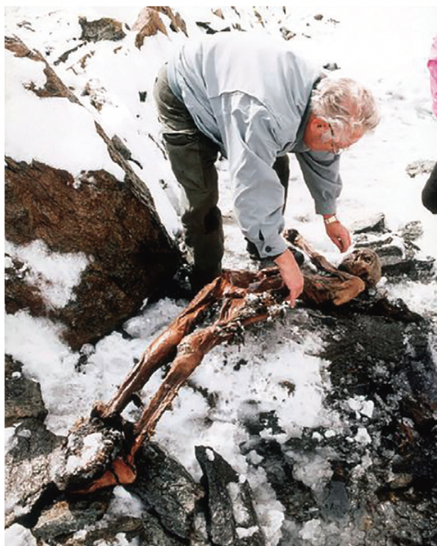
La mummia di Ötzi sul luogo del ritrovamento

Immedesimiamoci in Ötzi ed esercitiamo la metacognizione, divertendoci a rispondere a queste domande: “Che cosa posso abbattere con una robusta ascia di rame? Qual è lo strumento utile a tagliare pezzetti di cibo? Con che cosa taglio/cucio pelli e pellicce?” e così via.