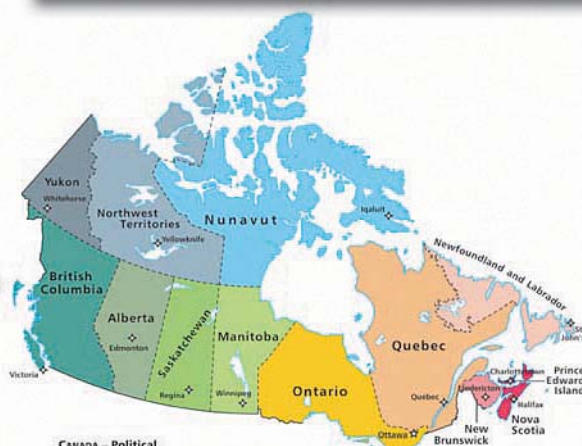
CANADA - Political